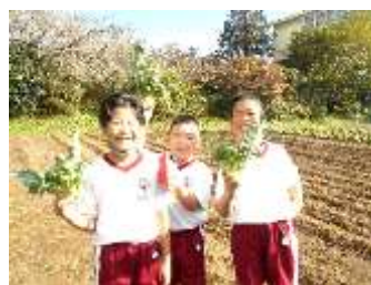
ブロッコリー初収穫