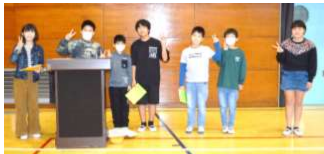
音楽集会実行委員！