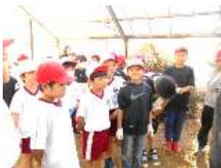
3年生：ぼっちづくり