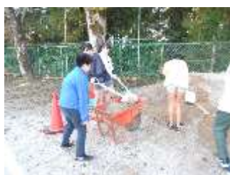
6年生：グラウンド整備