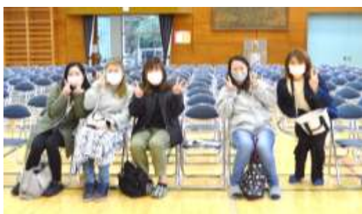
1 番のりの睦岡っ子応援団！